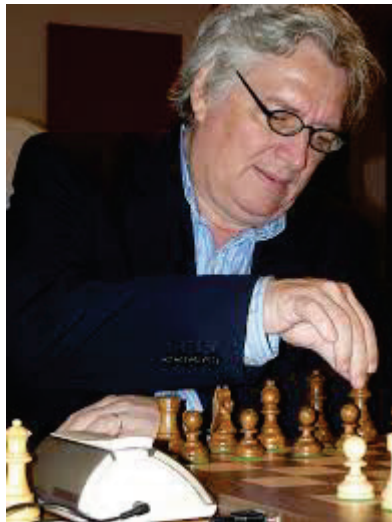
Jan Hendrik Timman

Concorso in due sezioni: sezione 1: a tema libero, riservata a giocatori/giocatrici con titoli FIDE; sezione 2: tematica: matto con l'Alfiere (oppure lotta contro il matto con l'Alfiere), aperta a tutti.